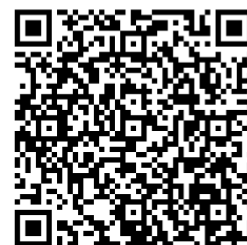
大会申込二次元コード

※各分科会は定員になり次第、締め切りとなります。 その際は、他の分科会へお回りください。